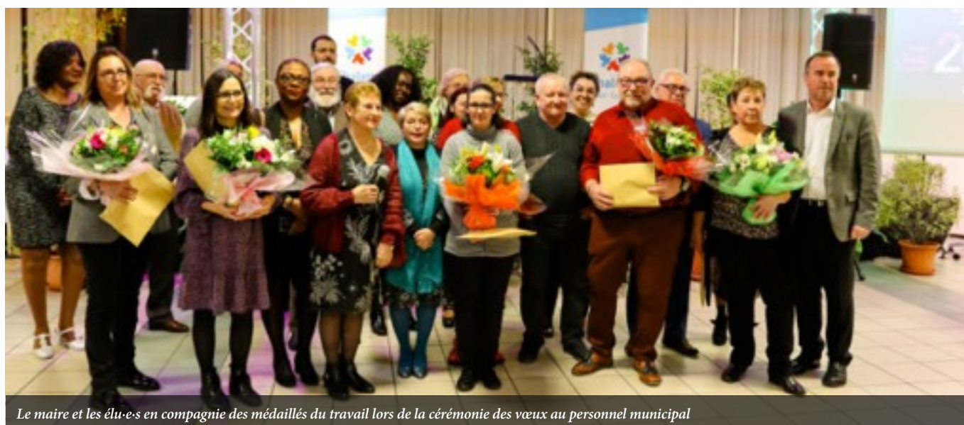
Le maire et les élu-e-s en compagnie des médaillés du travail lors de la cérémonie des vœux au personnel municipal