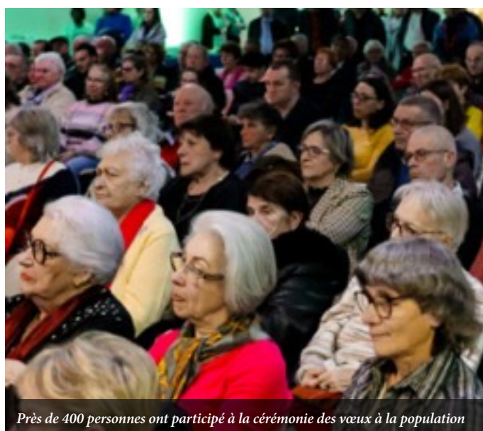
Près de 400 personnes ont participé à la cérémonie des vœux à la population