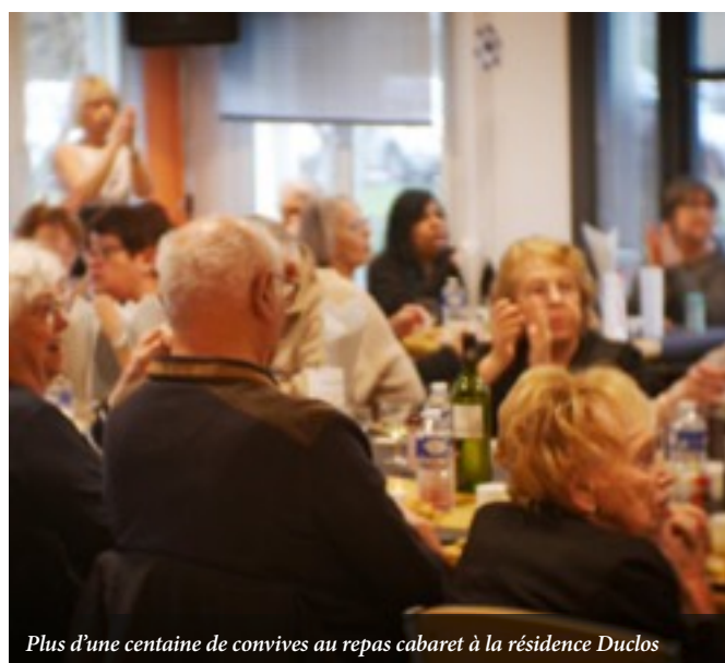
Plus d'une centaine de convives au repas cabaret à la résidence Duclos