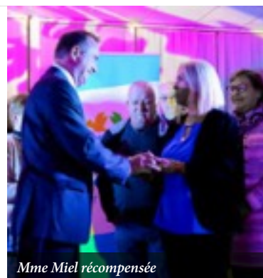
Mme Miel récompensée