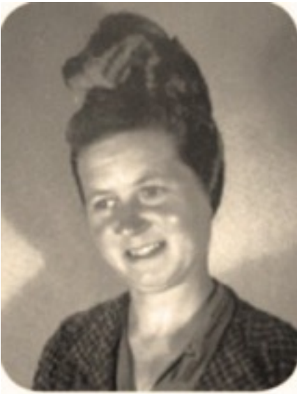
Lucienne Villechenon mat 57958.

L'allée Lucienne-Villechenon est une impasse longue de 50 mètres débouchant dans la rue Lucie-Aubrac. Elle se trouve dans le quartier de Vésines (délégation du conseil municipal du 23 juin 2008).