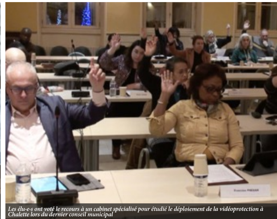
Les élu-e-s ont voté le recours à un cabinet spécialisé pour étudier le déploiement de la vidéoprotection à Chalette lors du dernier conseil municipal

effet inciter les délinquants à ne pas passer à l'acte et ainsi prévenir des dégradations causées à des personnes ou des biens exposés à des risques d'agressions. Cela peut également être un appui pour les forces de l'ordre en cas de délits en flagrance et ainsi aider à élucider des affaires. Cet outil ne vise pas à remplacer la présence policière sur la voie publique, qui a par ailleurs été renforcée les années passées, il sert exclusivement à soutenir le dispositif de sécurité sur le territoire municipal.