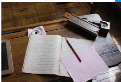
L'école d'antan au Musée d'école