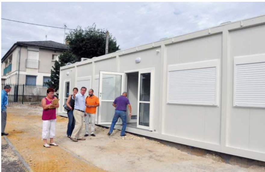
Deux classes modulables ont été installées à l'école maternelle de Vésines.