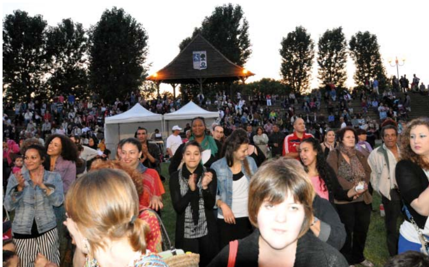
La Fête de Chalette, un rendez-vous convivial

Chalette Place Commune : Quelle est la place des associations dans l'organisation de la Fête de Chalette ?