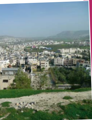
Vers un accord de coopération