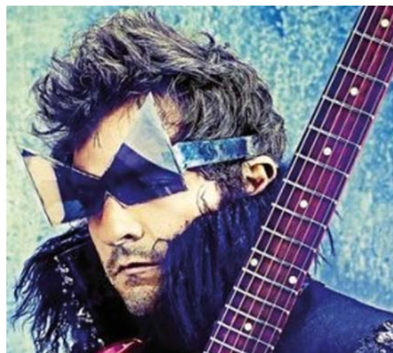
M, alias Matthieu Chedid, tête d'affiche du Printemps de Bourges ouvrira le festival le mardi 23 avril