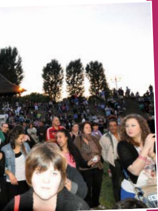
Fête de Chalette

L'enfant entre en contact physique et affectif avec le livre dans sa petite enfance (p.12).