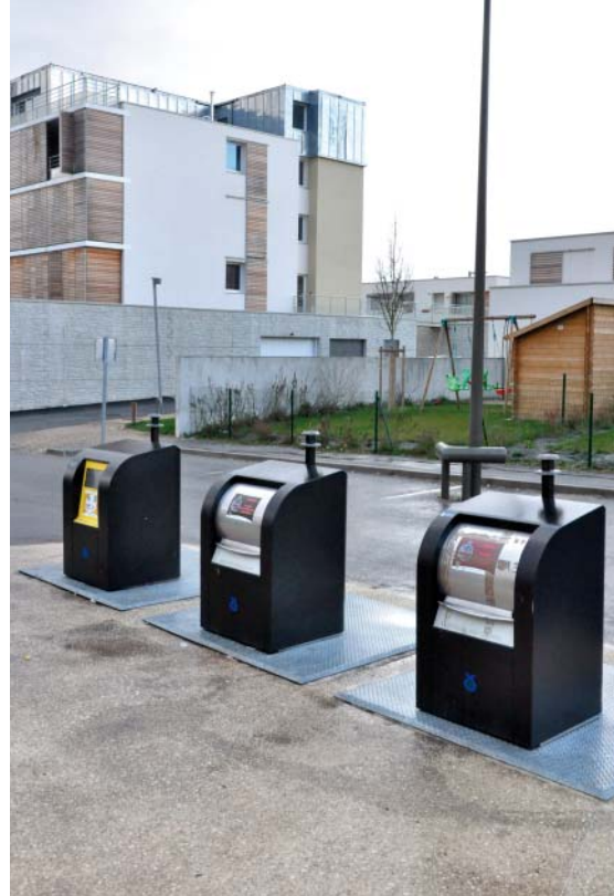
Conteneurs enterrés au Château-Blanc.