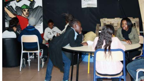
Les jeunes se retrouvent à la salle de quartier du Château-Blanc.

Dans le cadre du C.E.L. (1) nouvelle formule, l'État réoriente sa participation vers les 11-15 ans. C'est pourquoi, la Ville déploie de nombreuses activités, malgré une augmentation des dépenses en direction des plus jeunes en prévision de la mise en place de la réforme des rythmes scolaires.