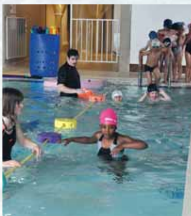
Premier contact avec l'eau