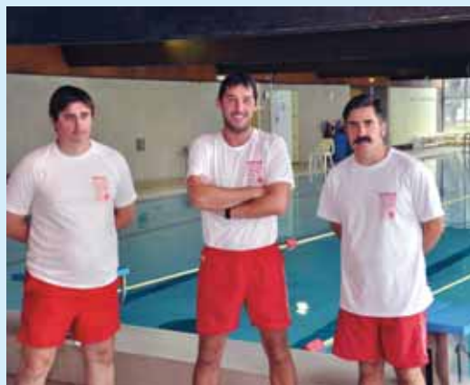
L'équipe des maîtres-nageurs

La piscine est ouverte toute l'année. Renseignements : 02.38.93.01.04