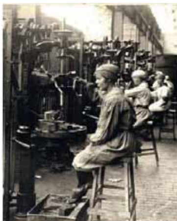
Femmes à l'usine