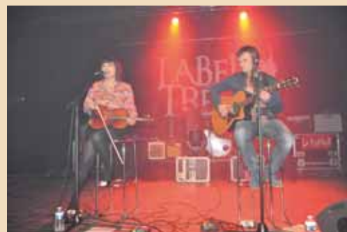
Les Ailes au Nord

Pour plus d'informations, rendez-vous sur le site Internet http://www.labeltrepmp.fr/ .