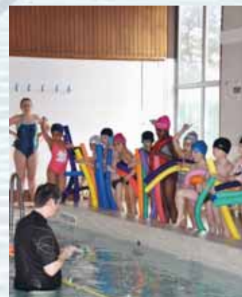
Les «frites» sont de sortie