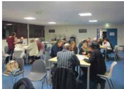
Le 10 mars à la Maison des associations

trale de la Ville, avec une partie des produits faits maison ou de provenance locale.