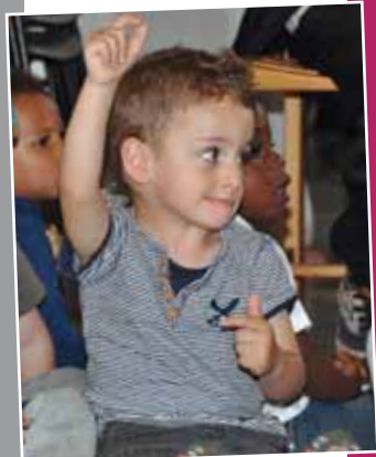
Au cœur de la petite enfance P.6