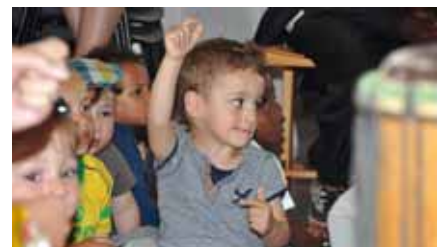
Fête de la crèche, juin 2014