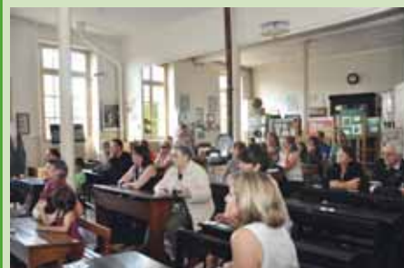
Musée d'école lors d'une animation en octobre 2014

Samedi 18 avril 2015, de 14 h 30 à 16 h 30, venez passer votre Certificat d'étude en vous amusant et en testant vos connaissances au Musée d'école. Tous les participants seront récompensés en recevant un diplôme lors des 20 ans du Musée le samedi 30 mai 2015.