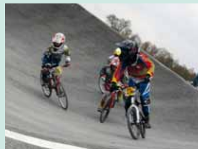
Première manche du Challenge départemental de BMX

Le 22 mars dernier, la section BMX du Guidon chalettois a accueilli la première manche du Challenge départemental du Loiret. Sur sa piste installée face au lac de Chalette, 169 compétiteurs, des prélicenciés aux seniors, se sont affrontés. Prochain rendez-vous pour le BMX à Chalette le 14 juin avec la 5 ème manche de la Coupe du Centre. Mais d'ici là, et sur la route, il sera possible de voir le Guidon chalettois le 12 avril à Chalette pour le Prix du Lancy, le 1 er mai à Corquilleroy pour le prix SARL Guérola et Espace Confort, et le 19 mai à Chalette pour le Prix de la Ville de Chalette et de l'A.M.E.