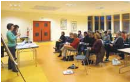
Le 19 février à l'école Camille-Claudet

Les réunions étaient préparées et animées par le bureau d'études RCT, sous une forme originale qui a manifestement été appréciée par les participants. Après avoir assisté à une rapide présentation des notions de développement durable et d'Agenda 21, ils ont été invités à échanger de manière ludique afin de mieux se connaître et comprendre les sujets à traiter. Les jeux variaient selon les groupes : photo-interprétation, jeu de rôles ou « portrait chinois »... Ensuite, passage aux choses sérieuses : le travail en sous-groupe pour réfléchir aux enjeux et proposer des actions au regard des trois engagements de la Ville. Ces sessions de 2 heures 30 ont été agréablement entrecoupées d'une collation réalisée par la cuisine cen-