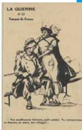
LA GUERRE N° 43 Femmes de France

Pour autant, si un consensus national met très majoritairement en valeur le sexe féminin cantonné dans son rôle de mère aimante, épouse fidèle, infirmière dévouée,