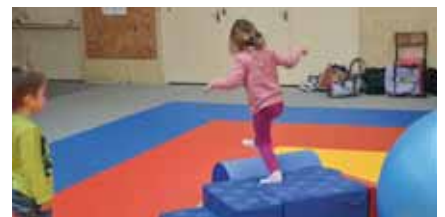
Atelier motricité du RAM au Dojo Jean-Zay, le 13 juin 2013