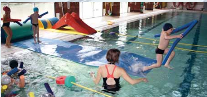
Ça va faire «splash»