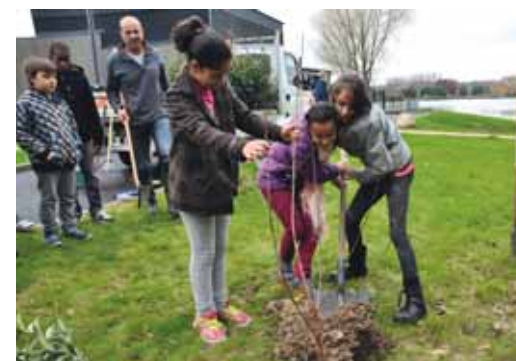
Plantation d'arbres autour du Restaurant sur le lac par le Conseil municipal des enfants, 26 novembre 2014

procéder au nettoyage des rues adjacentes et donner l'exemple. Soutenus par le service « Ville propre » de la Ville et ses agents qui mettront à leur disposition deux ou trois camions, des gants et des sacs poubelles, ils arpentent les rues du quartier : rues Saint-Just, Edouard-Lalo, boulevard Kennedy, rue de la Pontonnerie, et le square Maurice-Ravel. Samedi 18 avril, les élus du C.M.E. appellent les Chalettois à faire de cette matinée un rassemblement citoyen d'ampleur et à s'engager à garder propre leur cité.