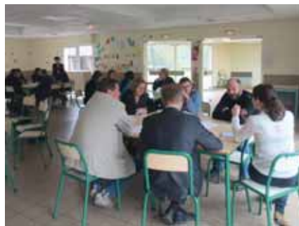
Le 10 mars, midi, au centre Aragon