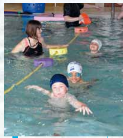
Une acclimatation dans la joie