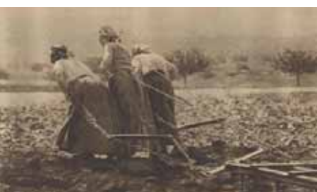
Femmes tirant la charrue