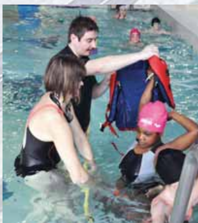
Contre l'appréhension, on rassure