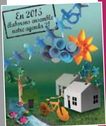
Agenda 21 La concertation en marche P.7