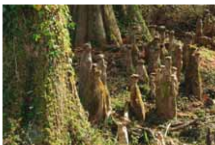
Racine de cyprès chauve

Dédié à la tranquillité aussi bien des promeneurs que des animaux, ce site protégé, ouvert au public, est accessible en passant sous le pont des cinq arches. La barrière franchie, on entre dans un autre monde... Le livret pédagogique qui lui est consacré retrace l'histoire de ce site naturel, explique sa gestion et présente les principales espèces animales et végétales qu'on y trouve. Bien que protégé, la Ville a souhaité qu'il soit accessible au plus grand nombre. Un chemin ouvert à tout le monde (promeneurs, cyclistes et joggeurs) permet de le découvrir