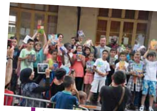
Photo de «famille» après la remise des prix à l'école élémentaire de Vésines.