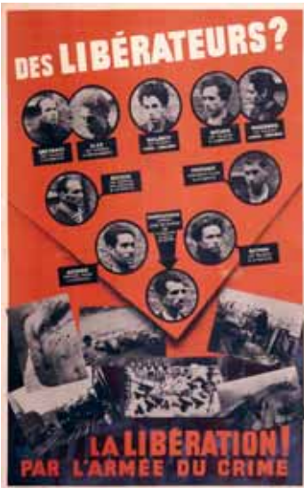
Affiche de propagande allemande dénonçant le réseau Manouchian qui faisait partie du groupe de résistance des « Francs-tireurs et partisans – main-d'œuvre immigrée »

Marine Remyot, d'après un texte de Michel Kister