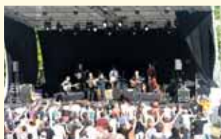
Debout sur le Zinc