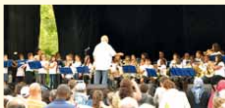
L'orchestre à l'école