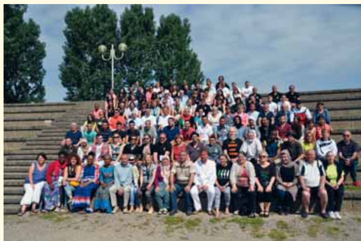
Les associations, le coeur battant de la Fête