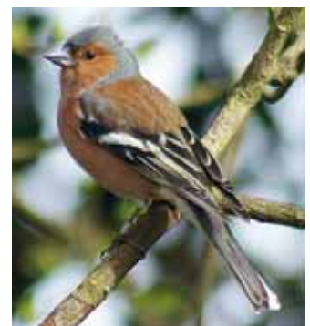
Pinson des arbres