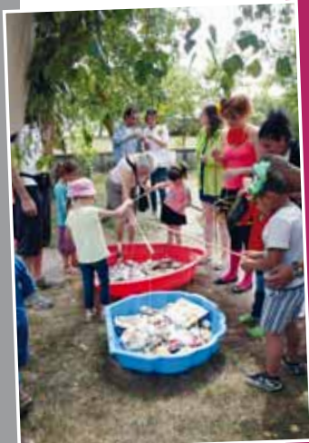
Retour sur les fêtes des écoles P.6