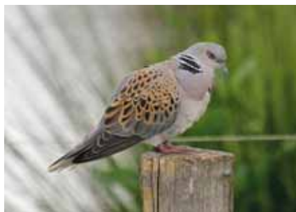
Tourterelle des bois