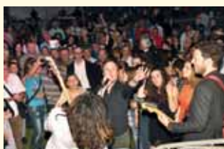
Stevans au coeur de son public