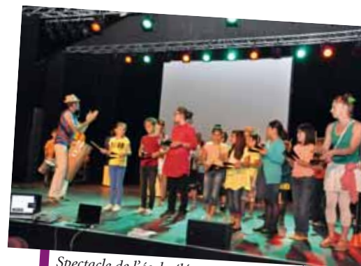
Spectacle de l'école élémentaire Pierre-Perret au Hangar.