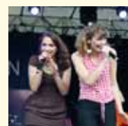
Demain la Veine