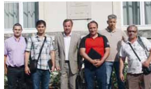
Les représentants syndicaux et le Maire à la Sous-préfecture

Enfin, les membres de la Cellule de veille économique ont rappelé