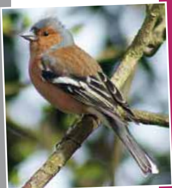
Des guides « nature » pour s'évader P.7