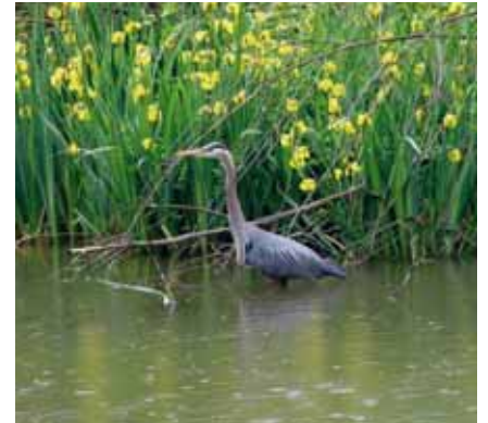
Iris des marais et héron