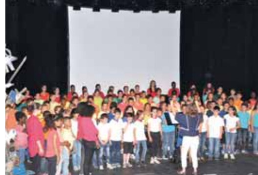
Lors de leur tour de chant, les élèves de l'école Pierre-Perret ont interprété l'émouvante chanson de Jean Ferrat, Nuit et Brouillard .

Si pour les lycées et les collèges la fin de l'année scolaire est consacrée aux examens, pour les écoles maternelles et élémentaires c'est au contraire le moment de la fête et celui de la présentation des travaux réalisés durant l'année. Ci-dessous quelques clichés des fêtes et kermesses qui se sont déroulées au mois de mai et début juin.