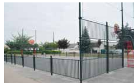
Plateau sportif dans le Bourg (le même que celui de la place Camus dans le quartier de la Pontommerie - notre photo)