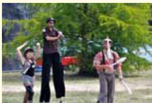
Les Croqueurs de pavés