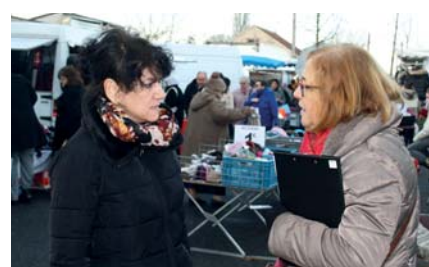
Les "Rencontres en marchant des Assises de la Ville", ici au marché de Vésines

Des actions en matière d'environnement sont à mettre au premier rang des préoccupations des habitants de Kennedy - Château-Blanc : « Il faut responsabiliser les habitants par rapport au tri », « apprendre aux enfants à ne pas jeter n'importe où, la Maison