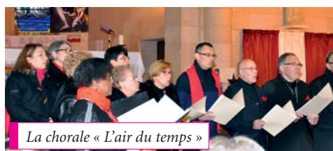
La chorale « L'air du temps »