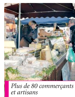
Plus de 80 commerçants et artisans