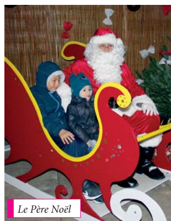
Le Père Noël