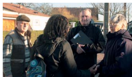
Les "Rencontres en marchant des Assises de la Ville", ici dans le quartier de la Pontonnerie

L'organisation du transport est retenue dans tous les quartiers comme