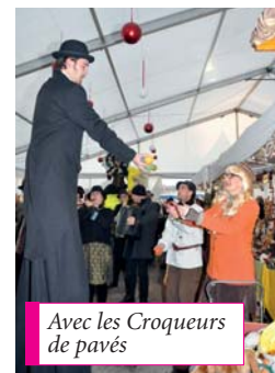
Avec les Croqueurs de pavés