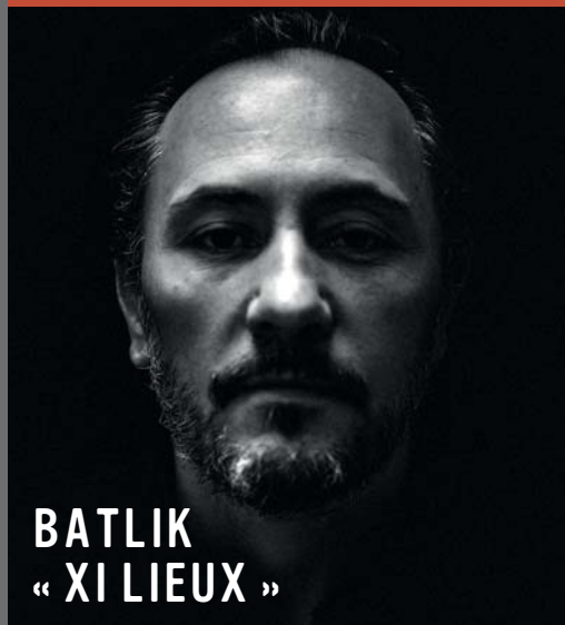
BATLIK « XI LIEUX »

Sa biographie place le curseur de l'autodérision en très haute altitude. Ainsi l'artiste le plus contre-productif d'Europe (dit-il !) sort un album tous les ans depuis 2004... Suivre son parcours musical revient à feuilleter un album photo. Les thèmes, l'écriture et l'orchestration ont mûri avec l'artiste, lentement, pas à pas, mais avec une rare persévérance. La chanson, d'abord réaliste ou militante, soutenue par une voix et un jeu de guitare scandés et percussifs a progressivement cédé la place à une musicalité plus dense, une interprétation plus ample autour de thèmes et d'une écriture toujours plus chargés de poésie.