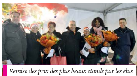
Remise des prix des plus beaux stands par les élus

M algré le froid et le brouillard, le Marché de Noël a tenu ses promesses et a accueilli durant deux jours plusieurs milliers de visiteurs. Comme de coutume, convivialité, produits de qualité, ambiance festive avec les Croqueurs de pavés et leurs invités ont permis à cette édition 2016 d'être une fois encore une réussite. Retour en images. Toutes les photos du marché et des festivités de fin d'année sur le site Internet de la Ville : www.ville-chalette.fr .