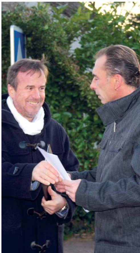
Les "Rencontres en marchant des Assises de la Ville", ici dans le quartier de la Pontonnerie

Juin 2016 à Chalette : la crue centennale restera gravée dans notre mémoire mais celle-ci nous aura démontré combien la SOLIDARITÉ s'exprime dans notre commune. Et je n'ai eu de cesse de remer-