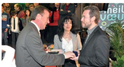
Remise de la médaille de la Ville pour « fait de bravoure » lors des inondations