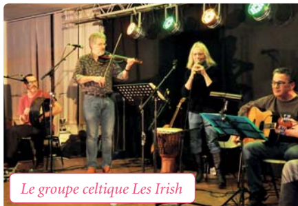
Le groupe celtique Les Irish