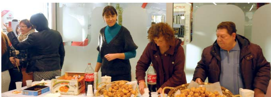
Le Noël de la solidarité du comité de quartier de Kennedy

Rôle moteur dans le renforcement du lien social, ces regroupements d'habitants ont également pour objectif de lutter contre l'isolement et favoriser les initiatives de solidarité. C'est d'ailleurs ce qu'un bon nombre de leurs membres a démontré lors des inondations de mai et juin derniers. Afin d'illustrer les propos ci-dessus, nous avons participé à la première réunion de l'année du comité de quartier du Lancy qui s'est déroulée mercredi 4 janvier.