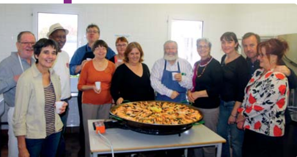
Le repas annuel du comité de quartier du Bourg