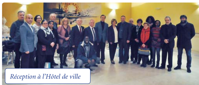
Réception à l'Hôtel de ville