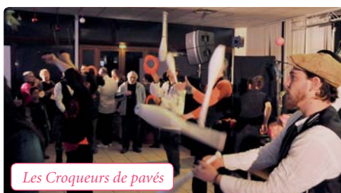
Les Croqueurs de pavés