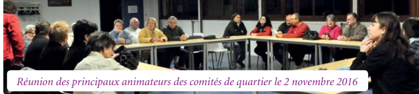
Réunion des principaux animateurs des comités de quartier le 2 novembre 2016