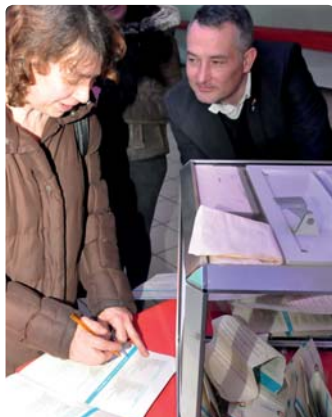
On remplit le questionnaire des Assises de la Ville

meilleurs vœux 2017 Tous acteurs à Chalette