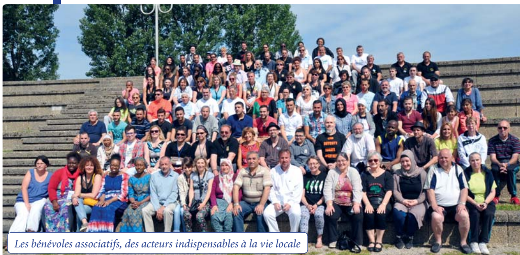
Les bénévoles associatifs, des acteurs indispensables à la vie locale