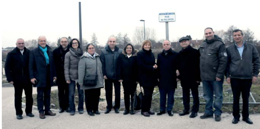
La délégation de la ville de Nilüfer dans la nouvelle rue située dans l'éco-quartier du Solin le 19 décembre 2016

« L'objectif de notre séjour en Palestine était de deux ordres : d'une part, rompre l'isolement du peuple palestinien, renforcer sa reconnaissance internationale et sa résistance légitime et, d'autre part, donner une suite à notre coopération avec le camp d'Askar. De plus, le Conseil municipal avait voté une subvention pour l'Institut français de Naplouse pour permettre à des jeunes Palestiniens de suivre des cours de français et, ainsi, de les sortir de leur quotidien qui s'assimile à une réelle situation d'apartheid. Ainsi, notre séjour a permis de rencontrer plusieurs interlocuteurs afin de trouver un lieu dans le camp pour ces cours. Cette visite a également été l'occasion de travailler sur un projet portant sur le