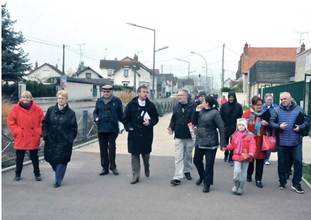
Rencontre avec les habitants du Bourg dans le cadre de l'étude sur la circulation le 26 novembre 2016

Vice-président de l'Agglomération montargoise