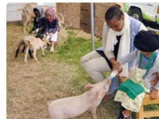
Les enfants de Cosson retrouveront les animaux de la ferme avec « Les Tromignons »

De plus, le centre Aragon propose un séjour Tipi à Argent-sur-Sauldre du 17 au 21 juillet. Il sera ouvert à 20 enfants âgés de 7 à 11 ans.