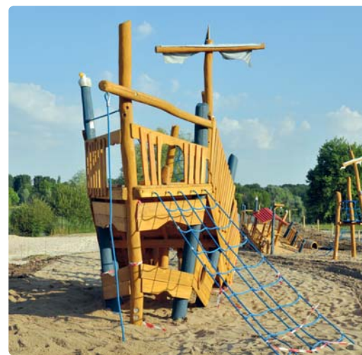
Le bateau pirate échoué sur la plage