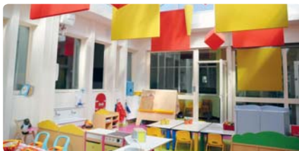
La salle d'activités de la crèche

petit-déjeuner dans le hall d'accueil pour recueillir les premières impressions et échanger brièvement avec les parents qui semblaient très satisfaits.