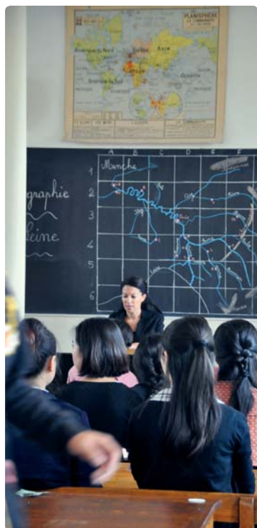
L'institutrice face à ses élèves chinoises

Depuis la reconnaissance de la Chine par la France et l'établissement de relations diplomatiques en 1964, les échanges culturels entre ces deux pays ainsi qu'avec les villes de Montargis et Chalette sont riches et empreints d'amitié. C'est dans cet état d'esprit que le Musée d'école Fernand-Bouttet a été choisi comme lieu de tournage d'une scène pour une série de télévision chinoise intitulée Xiang Jingyu . En effet, le Beijing Newland Cultural Artistic Center qui initie et accompagne des projets audiovisuels, notamment sur l'histoire révolutionnaire chinoise, a proposé que le Musée d'école Fernand-Bouttet soit le décor d'une des scènes de ce projet de série TV qui comprendra 40 épisodes dont 5 tournés en France. C'est la raison pour laquelle, le jeudi