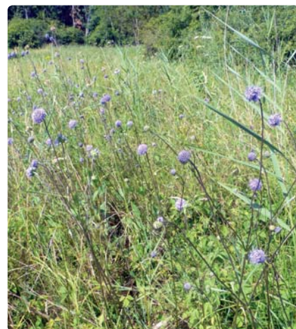
Succise des prés