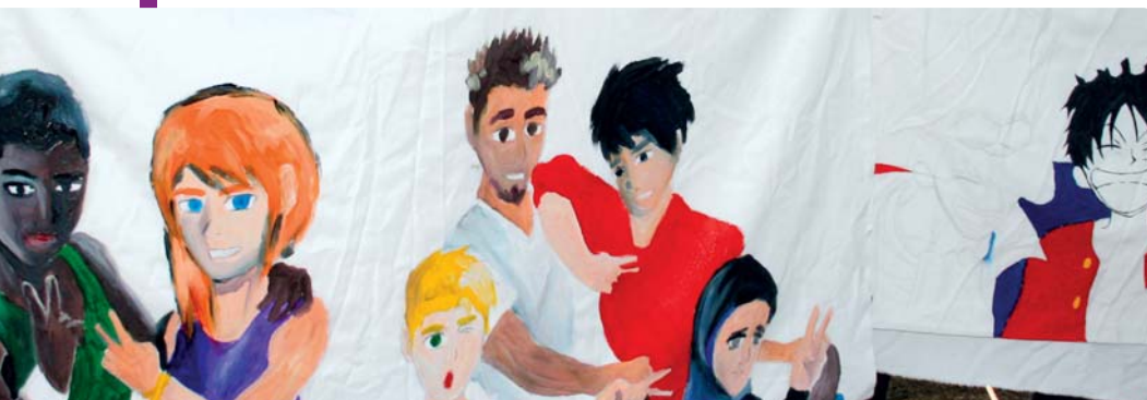
Fresque réalisée durant la journée par de jeunes Challettois

gée autour de quatre animations : une randonnée de la fraternité tout public avec pour objectif la découverte du patrimoine historique et environnemental de la ville, une parade intergénérationnelle et interculturelle sur le site de l'ancienne usine Van Leeuwen offrant la possibilité aux familles challettoises (grands-parents, parents, enfants, voire petits-enfants) de présenter leur pays ou leur région en défilant en costumes traditionnels, un spectacle sur la fraternité conçu et joué par les habitants assistés d'un professionnel et qui mettrait en scène les entraves et les bienfaits à faire vivre la Fraternité et, enfin, la réalisation d'un film le jour de la fête recensant différentes saynètes sur l'idée qu'ont les Challettois de la Fraternité. Sans oublier un grand repas fraternel et un ou des concerts en fin de journée. Quatre points forts qui ne demandent qu'à être enrichis par des initiatives de la population et des associations ; autant de projets restant à peaufiner mais qui réservent de jolies surprises. D'ores et déjà, réservez la date du 28 octobre !