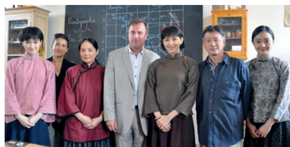
Le maire entouré des principales actrices (dont l'héroïne à droite du maire) et du réalisateur

27 juillet, une partie de la rue Gambetta (de la médiathèque à la Place de la République) était barrée afin de laisser la place à l'équipe du film, d'où une certaine effervescence notamment entre 12 heures et 13 heures 30.