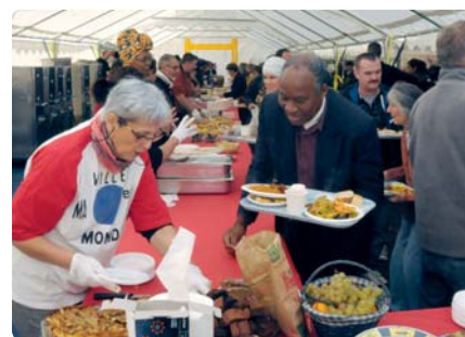
Journée de la fraternité 2016

Pour mettre en œuvre de façon ludique et festive cette volonté de partage, de débat et de mieux vivre ensemble, une réflexion s'est enga-