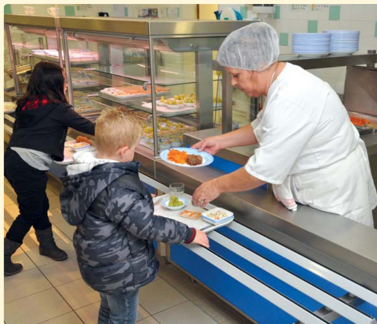
La ligne de self de l'école Pierre-Perret

Pour tous les quotients familiaux , l'actualisation des tarifs de la restauration scolaire et des accueils de loisirs représentera une augmentation de 0,11 € .