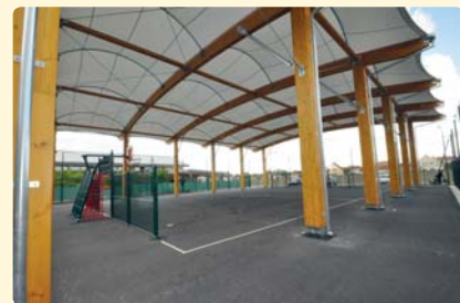
Nouveau plateau sportif de l'école Camille-Caudel

Quelques jours avant la rentrée scolaire, nous avons rencontré Marie-Madeleine Heugues, élue chargée des affaires scolaires. Elle nous fait un état des lieux de cette rentrée scolaire 2017.