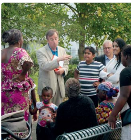
Les élus à la rencontre des habitants du quartier le 21 août dernier

Conscients de l'émotion suscitée par cette tragédie, les élus sont allés à la rencontre des habitants pour les écouter et leur exprimer leur solidarité tout en dénonçant les incendies