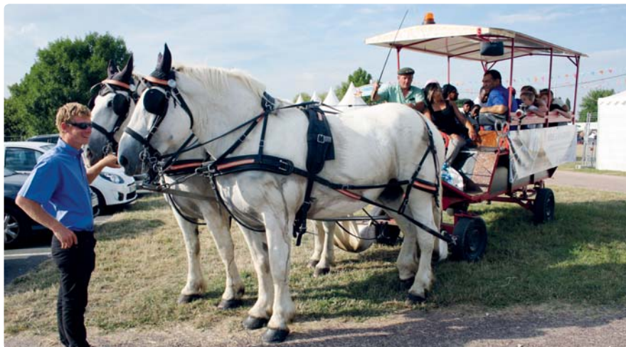
Des balades en calèche étaient proposées durant Chalette(F)estival

Retour en image sur le site Internet de la Ville : www.ville-chalette.fr