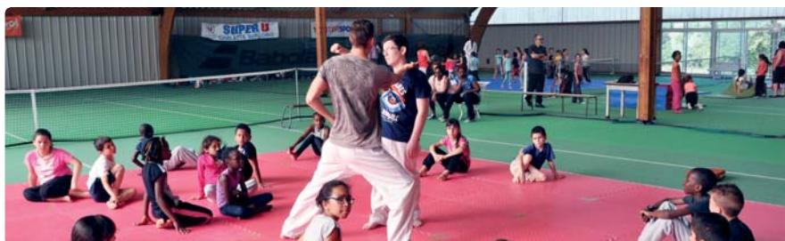
Initiation au taekwondo

Le samedi 16 septembre sera aussi un moment d'échanges sur la politique sportive que la Ville souhaite mener dans les prochaines années.