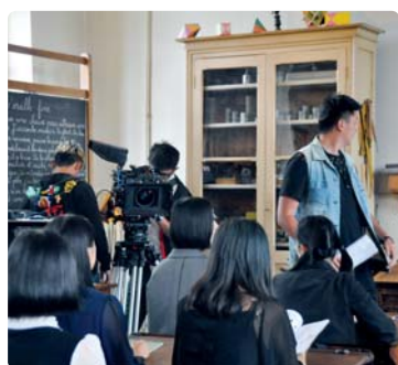
Mises en place et réglages