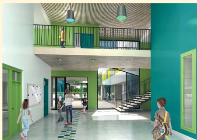
Perspective intérieure de la future école de Vésines

« La construction du groupe scolaire de Vésines se concrétise. En juin dernier, le projet a été présenté à l'équipe éducative et aux représentants des parents d'élèves, ce qui a permis de l'affiner. Les travaux devraient commencer en début d'année 2018 pour une livraison du bâtiment en 2019 de façon à pouvoir aménager l'établissement pour la rentrée de la même année. Pour mémoire, ce nouveau groupe scolaire sera implanté sur le site de l'actuel stade du Bouy, rue Gaston-Jaillon ».