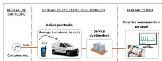
Principe de la télé-relève

Au vu de ces appréciations, les élus chalettois ont voté contre cette délégation de service public au profit de Suez, jugeant que ces contrats ne correspondent pas à la hauteur d'un projet ambitieux pour tous les usagers et pour notre agglomération, face au défi économique, social et écologique pour ces dix prochaines années.