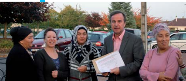
Remise des pétitions contre la suppression des EVS au maire par les parents d'élèves de l'école M.-Moineau

sion pour signifier leur mécontentement : la remise d'une pétition au maire signée par plusieurs dizaines d'entre eux. Celle-ci a été transmise à l'inspecteur de l'Éducation nationale par le maire qui n'a pas manqué de souligner les moyens déployés par la Ville dans l'accompagnement des professeurs dans leurs missions (dispositifs de classe de découverte, activités de pleine nature, aide aux études surveillées et maintien des activités périscolaires, etc.). Et de conclure en demandant la mise en place du dispositif de 12 élèves par classe en CP sans remettre en cause les effectifs d'enseignants affectés selon le principe « plus de maîtres que de classe ».