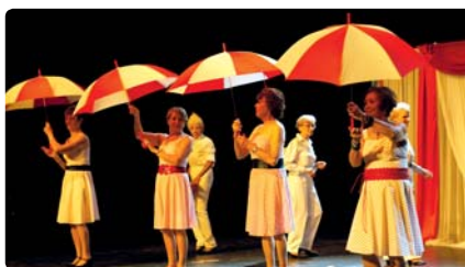
Représentation de l'atelier-danse

nant saluer les répliques et attitudes drôles, voire grivoises parfois, des acteurs. Car au Grenier chalettois, on ne se prend pas au sérieux, on s'amuse et en plus on fait travailler sa mémoire. En tout cas, les 7 et 8 octobre derniers, avant que le rideau ne retombe une dernière fois la petite troupe entourée du maire et de plusieurs élus n'a pas failli à la tradition en soufflant les 25 bougies qui trônaient sur un gigantesque gâteau d'anniversaire.