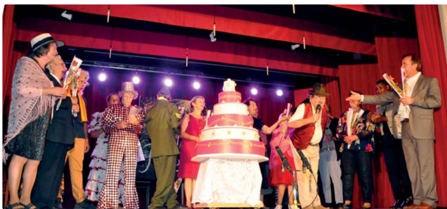
Le Grenier chalettois fidèle aux Rencontres d'octobre

nant saluer les répliques et attitudes drôles, voire grivoises parfois, des acteurs. Car au Grenier chalettois, on ne se prend pas au sérieux, on s'amuse et en plus on fait travailler sa mémoire. En tout cas, les 7 et 8 octobre derniers, avant que le rideau ne retombe une dernière fois la petite troupe entourée du maire et de plusieurs élus n'a pas failli à la tradition en soufflant les 25 bougies qui trônaient sur un gigantesque gâteau d'anniversaire.