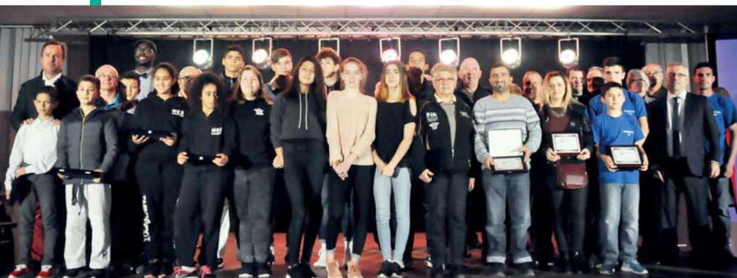
Les trophées des sports 2016

Cette soirée est avant tout un temps où le mouvement sportif chalettois est mis à l'honneur, et ceci grâce à son engagement et son rayonnement dans la commune.