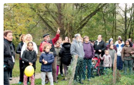
La balade fraternelle