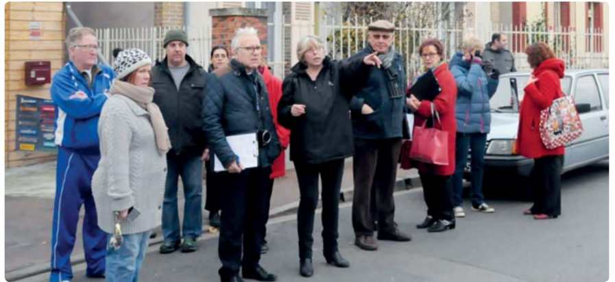
Rencontre avec les riverains du Bourg, 26 novembre 2016

En concomitance, d'ici la fin de cette année, les rues Jeanne-d'Arc, Poncet, Rosa-Bonheur, Édouard-Vail-