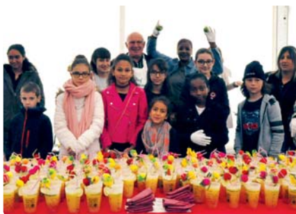
Le cocktail du Conseil municipal des enfants