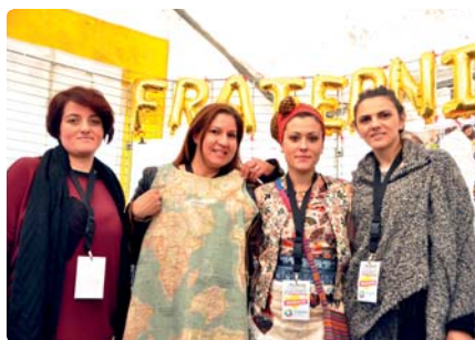
Au centre, la robe du monde et celle de la fraternité