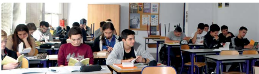
La classe de terminale en pleine lecture