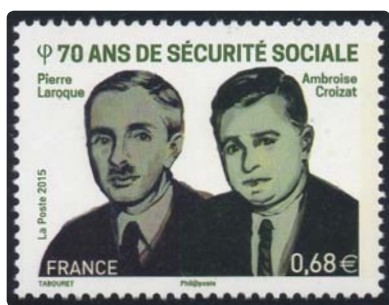
Timbre commémorant les 70 ans de la Sécurité sociale, avec Pierre Laroque et Ambroise Croizat