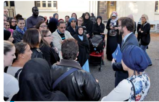
Les parents d'élèves de l'école de Vésines s'entretiennent avec l'inspecteur de l'Éducation nationale

Quant à la suppression des EVS, à l'école de la Pontonnerie les parents ont choisi un autre mode d'expres-