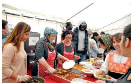
Le repas du monde