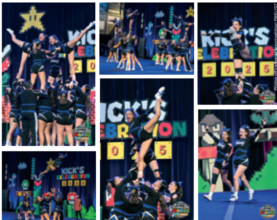
Photos officielles de la compétition PIXELYST

Le club de cheerleading « Galaxy Cheer » de Chalette, a réalisé un véritable exploit en remportant sa catégorie lors de la compétition « Kicks Célébration » à Montréal. Un voyage inoubliable qui restera gravé dans les mémoires du club.