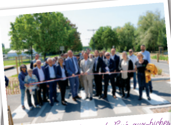
L'inauguration de la rue du Gué-aux-biches