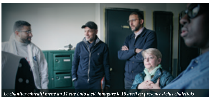
Le chantier éducatif mené au 11 rue Lalo a été inauguré le 18 avril en présence d'élus chalettois