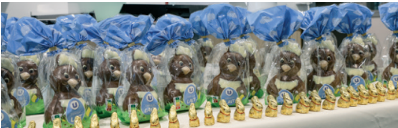
Dimanche 20 avril, les cloches sont passées au CACB pour le plus grand plaisir des enfants ! Ce sont en tout 35 personnes qui ont participé à la chasse au trésor. Le but du jeu ? Découvrir sous l'eau des personnages et des lettres composant une phrase surprise permettant de gagner une belle poule en chocolat !