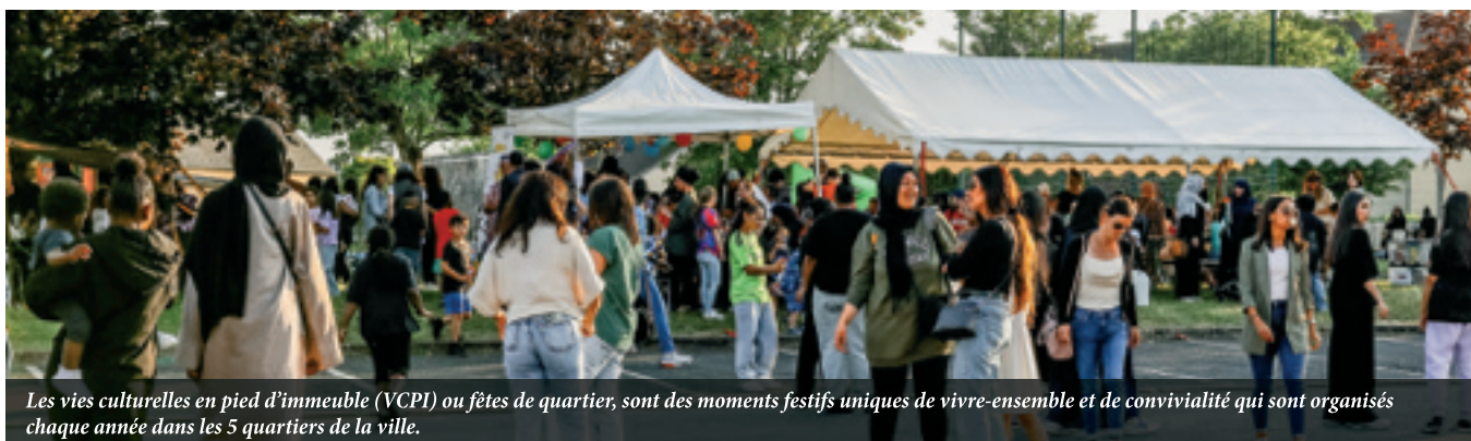
Les vies culturelles en pied d'immeuble (VCPI) ou fêtes de quartier, sont des moments festifs uniques de vivre-ensemble et de convivialité qui sont organisés chaque année dans les 5 quartiers de la ville.