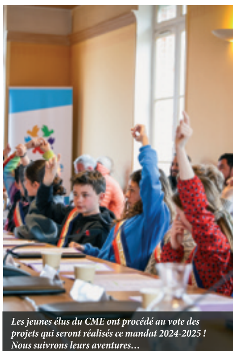
Les jeunes élus du CME ont procédé au vote des projets qui seront réalisés ce mandat 2024-2025 ! Nous suivrons leurs aventures...