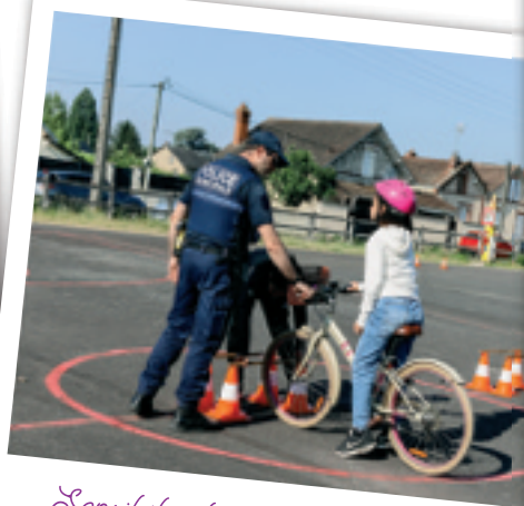
Sensibilisation à la sécurité routière

Les sentiers de promenade ont été rénovés pour offrir aux habitants des parcours agréables en pleine nature, favorisant ainsi les activités de plein air et le bien-être. Par ailleurs, la baignade municipale a été réaménagée pour améliorer ses infrastructures et garantir un espace de loisirs de qualité pour tous.