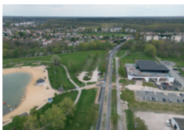
L'aménagement de la base de loisirs