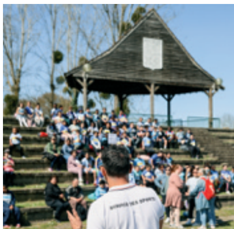
Le 3 avril, les élèves de CM1 et CM2 des écoles chalettoises ont participé à la Course bleue organisée chaque année par le service des sports dans le cadre de la sensibilisation à l'autisme