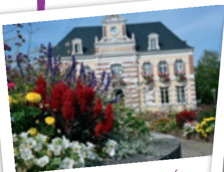
Les espaces verts