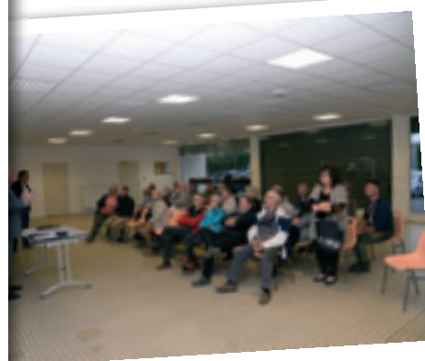
Réunion publique avec les riverains