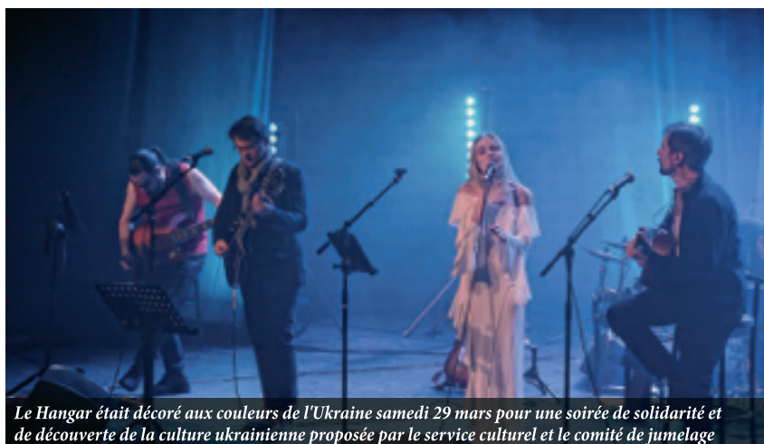
Le Hangar était décoré aux couleurs de l'Ukraine samedi 29 mars pour une soirée de solidarité et de découverte de la culture ukrainienne proposée par le service culturel et le comité de jumelage