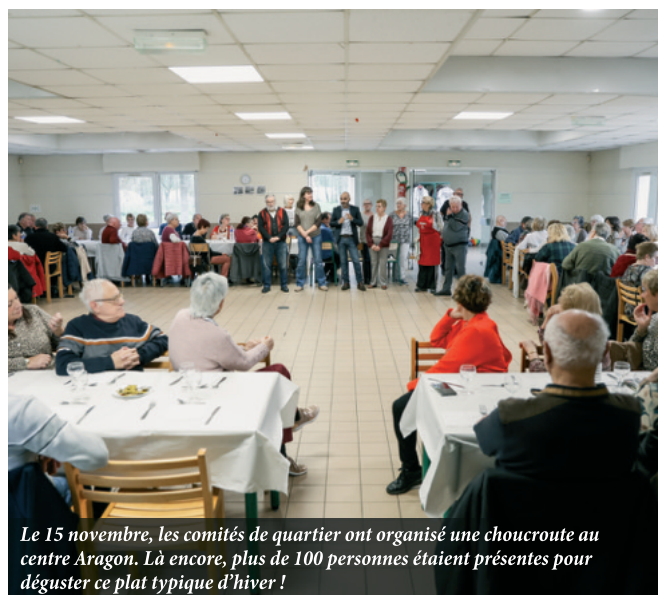
Le 15 novembre, les comités de quartier ont organisé une choucroute au centre Aragon. Là encore, plus de 100 personnes étaient présentes pour déguster ce plat typique d'hiver !