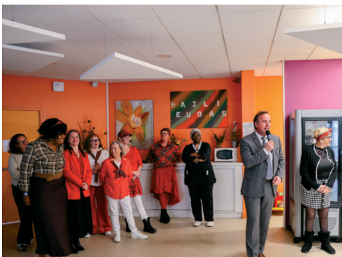
Jeudi 20 novembre, c'était le repas Beaujolais à la résidence Jacques-Duclos. Plus de 100 personnes étaient présentes pour apprécier cet événement sur le thème de l'Écosse !