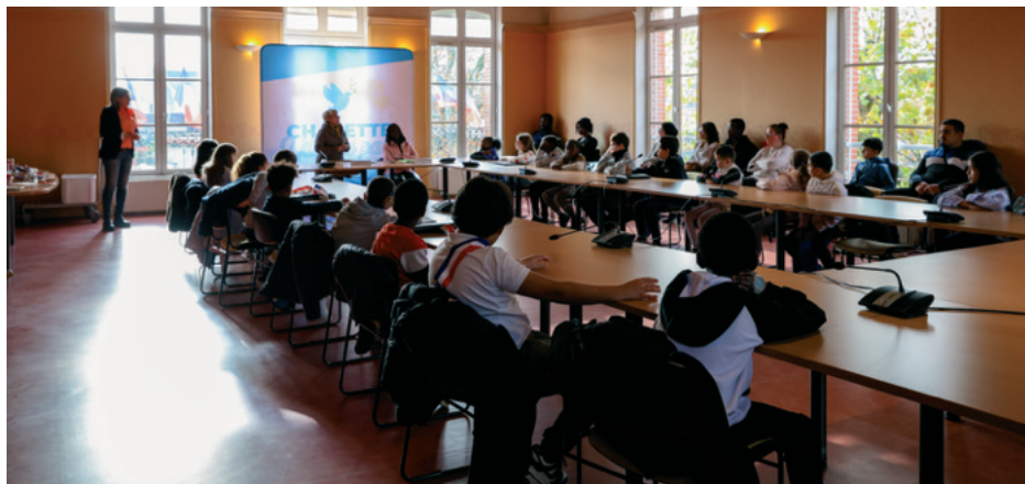
3 Chalette Place Commune

À travers échanges et explications, les enfants ont pu mieux comprendre ce que représente leur nouvelle responsabilité : participer à la vie de la commune, proposer des idées, travailler en équipe et mener des projets concrets au service des élèves de la ville et de la population chalettoise. Leur mandat a officiellement débuté le mercredi 26 novembre.