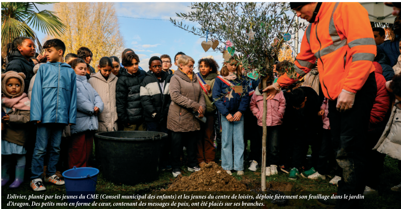
L'olivier, planté par les jeunes du CME (Conseil municipal des enfants) et les jeunes du centre de loisirs, déploie fièrement son feuillage dans le jardin d'Aragon. Des petits mots en forme de cœur, contenant des messages de paix, ont été placés sur ses branches.